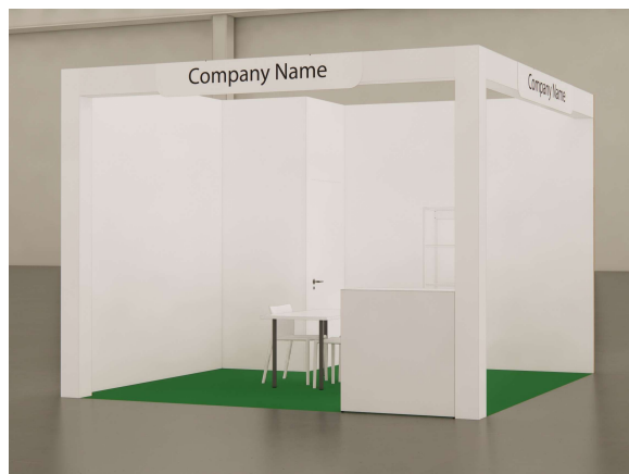
Vista | immagine indicativa - View | sample image