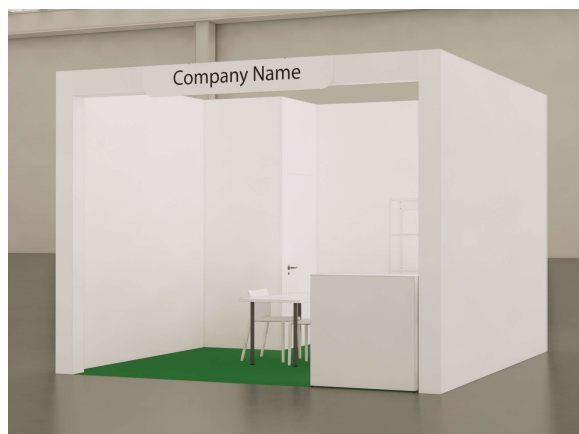
Vista | immagine indicativa - View | sample image

Maximum load allowed on each shelf 5kg * shelf fitted at 110,140,170 cm high. for any changes, contact Henoto15 days from the start of the event to the email address: sana.setup@henoto.com