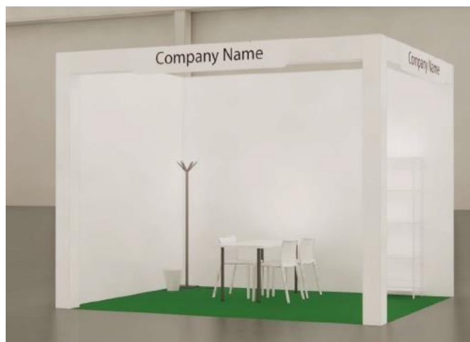
vista | immagine indicativa

Stand preallestiti Tamburato h300 verniciabile