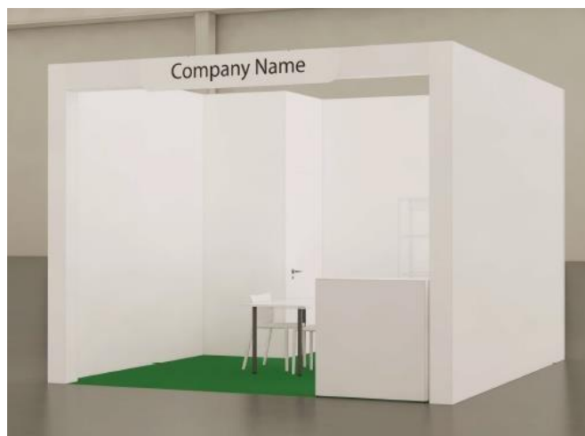
vista | immagine indicativa